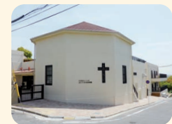
ぶどうの木保育園