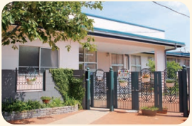
宇山光の子保育園