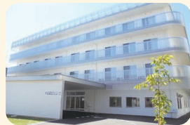
真愛あらたホーム