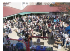
愛隣館研修センター