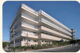
真愛たきやまホーム