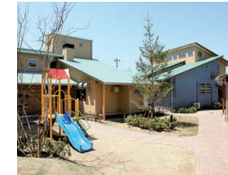
ガーデンエル・ロイ

すべての子どもが「生まれてきてよかった」と心から言える社会を求めて、困難な環境で過ごす子どもたちを健やかに育む施設です。家庭復帰のための支援や里親の受け入れ推進などの活動も行っています。