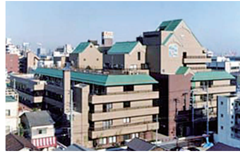
神戸高齢者総合ケアセンター真愛

イエス団の高齢者施設・サービスでは、一人ひとりを「個性豊かな一人の人」として受け止め、専門性を高め、尊い生命と生活を守り、日々喜びがあるように努めています。特別養護老人ホーム、デイサービス、居宅支援など、地域のニーズに応じたさまざまなサービスを展開しています。