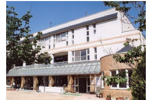
甲子園二葉幼稚園

かぎりない可能性が開く大切な乳幼児期を、愛あふれる環境で育てたい。イエス団の運営する園では、喜びと希望の中で子どもたちが力いっぱい育つ保育環境を創りだしています。