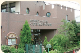
くずは光の子保育園