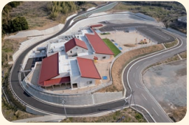
みなべ愛之園こども園