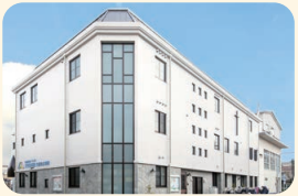
天使保育園・天使ベビーセンター