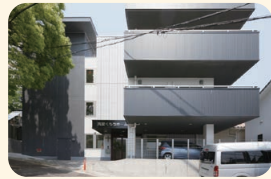
真愛くもちホーム