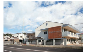
かがわ子ども子育て支援センター 育愛館（保育園） 神愛館（乳児院）

未就園の乳幼児や、その保護者を対象に、交流の場の提供や、育児相談・講習会・他機関とのコーディネートを行い、地域の子育て力の向上に努めています。