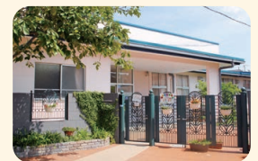
宇山光の子保育園