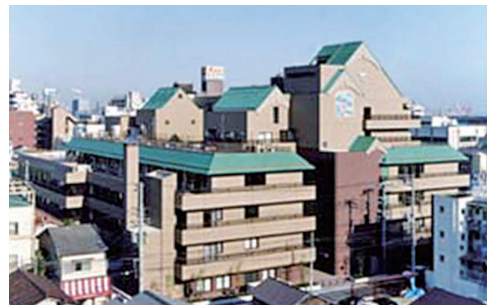
神戸高齢者総合ケアセンター真愛

イエス団の高齢者施設・サービスでは、一人ひとりを「個性豊かな一人の人」として受け止め、専門性を高め、尊い生命と生活を守り、日々喜びがあるように努めています。特別養護老人ホーム、デイサービス、居宅支援など、地域のニーズに応じたさまざまなサービスを展開しています。