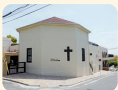
ぶどうの木保育園