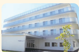
真愛あらたホーム