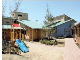
ガーデンエル・ロイ

すべての子どもが「生まれてきてよかった」と心から言える社会を求めて、困難な環境で過ごす子どもたちを健やかに育む施設です。家庭復帰のための支援や里親の受け入れ推進などの活動も行っています。