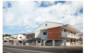
かがわ子ども子育て支援センター 育愛館（保育園） 神愛館（乳児院）

未就園の乳幼児や、その保護者を対象に、交流の場の提供や、育児相談・講習会・他機関とのコーディネートを行い、地域の子育て力の向上に努めています。