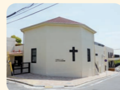
ぶどうの木保育園