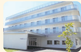
真愛あらたホーム