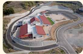
みなべ愛之園こども園