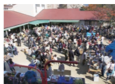
愛隣館研修センター