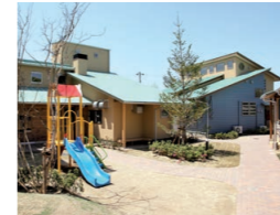
ガーデンエル・ロイ

すべての子どもが「生まれてきてよかった」と心から言える社会を求めて、困難な環境で過ごす子どもたちを健やかに育む施設です。家庭復帰のための支援や里親の受け入れ推進などの活動も行っています。