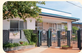
宇山光の子保育園