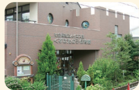
くずは光の子保育園