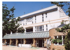
甲子園二葉幼稚園

かぎりない可能性が花開く大切な乳幼児期を、愛あふれる環境で育てたい。イエス団の運営する園では、喜びと希望の中で子どもたちが力いっぱい育つ保育環境を創りだしています。