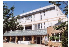
甲子園二葉幼稚園

かぎりない可能性が花開く大切な乳幼児期を、愛あふれる環境で育てたい。イエス団の運営する園では、喜びと希望の中で子どもたちが力いっぱい育つ保育環境を創りだしています。