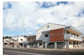
かがわ子ども子育て支援センター 育愛館（保育園） 神愛館（乳児院）

未就園の乳幼児や、その保護者を対象に、交流の場の提供や、育児相談・講習会・他機関とのコーディネートを行い、地域の子育て力の向上に努めています。