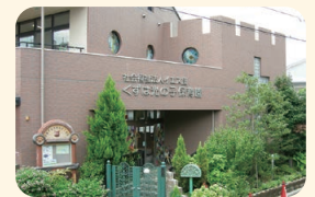
くずは光の子保育園