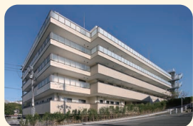
真愛たきやまホーム