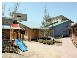
ガーデンエル・ロイ

すべての子どもが「生まれてきてよかった」と心から言える社会を求めて、困難な環境で過ごす子どもたちを健やかに育む施設です。家庭復帰のための支援や里親の受け入れ推進などの活動も行っています。