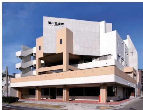
賀川記念館・友愛幼稚園