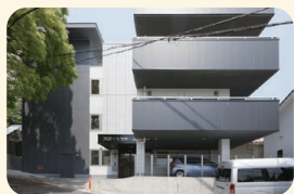
真愛くもちホーム