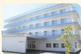
真愛あらたホーム