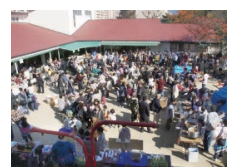
愛隣館研修センター