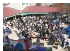
愛隣館研修センター