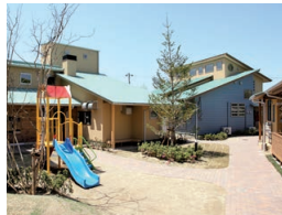
ガーデンエル・ロイ

すべての子どもが「生まれてきてよかった」と心から言える社会を求めて、困難な環境で過ごす子どもたちを健やかに育む施設です。家庭復帰のための支援や里親の受け入れ推進などの活動も行っています。