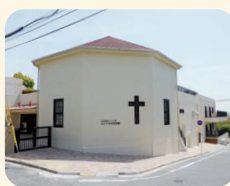
ぶどうの木保育園