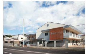
かがわ子ども子育て支援センター 育愛館（保育園） 神愛館（乳児院）

未就園の乳幼児や、その保護者を対象に、交流の場の提供や、育児相談・講習会・他機関とのコーディネートを行い、地域の子育て力の向上に努めています。