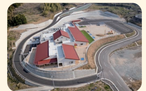
みなべ愛之園こども園