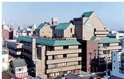
神戸高齢者総合ケアセンター真愛

イエス団の高齢者施設・サービスでは、一人ひとりを「個性豊かな一人の人」として受け止め、専門性を高め、尊い生命と生活を守り、日々喜びがあるように努めています。特別養護老人ホーム、デイサービス、居宅支援など、地域のニーズに応じたさまざまなサービスを展開しています。